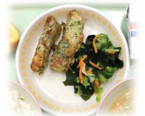
【ちくわの新茶揚げ】

給食では5月2日に「ちくわの新茶揚げ」、5月19日に「揚げ抹茶ビーンズ」が登場します。(写真は令和4年度)