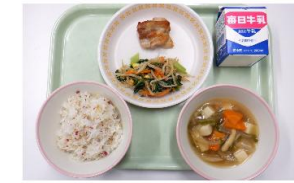
2026.6.5 全国郷土料理めぐり献立! 神奈川県「けん ちん汁」NEW!

全国郷土料理巡り献立 や学校での活動を紹介 しています。 ぜひ見に来てください。